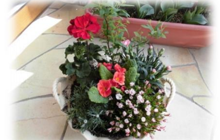
春の草花を使った寄せ植え