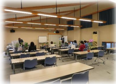
洋ランの植替えと育て方②